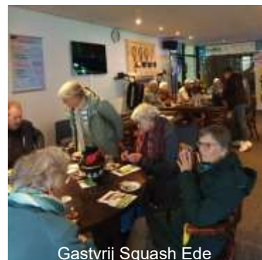
Gastvrij Squash Ede