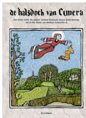
Stripboek van De Inktpot