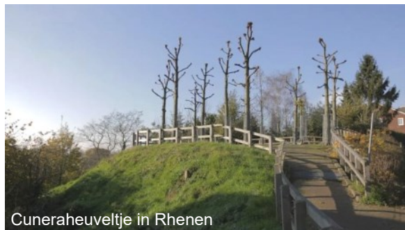
Cuneraheuveltje in Rhenen

terwijl ze onderwijl hard krijst. Volslagen doorgedraaid werpt Cunera's moordenaars zich uiteindelijk van een berg (mogelijk de Grebbeberg, Donderberg of Laarseberg).