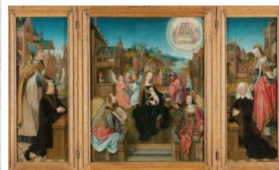
Drieluik van Meester van Delft rechts Cunera