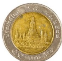
10 bath - Thailand