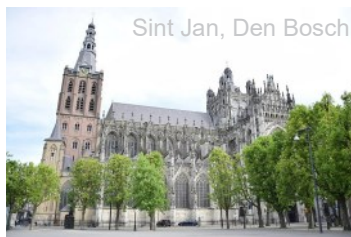
Sint Jan, Den Bosch

Een kathedraal of dom is de kerk waar een bisschop zetelt. De benaming valt te herleiden tot ecclesia cathedralis , kerk van de zetel. Het gaat dan om de zetel van de bisschop, die aan de zijkant van het priesterkoor van de kerk staat opgesteld, in de vroegchristelijke kerk in de exedra of de koorapsis. Deze zetel heet in het Latijn cathedra.