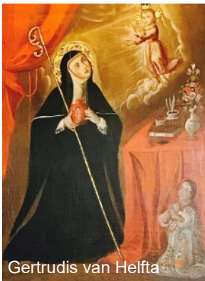
Gertrudis van Helfta

Volgens de Heiligenkalender is dat Gertrudis van Helfta of Gertrudis de Grote (1256-ca.1302). Zij was een christelijke mystica. Zij behoort tot de kring van mysticae