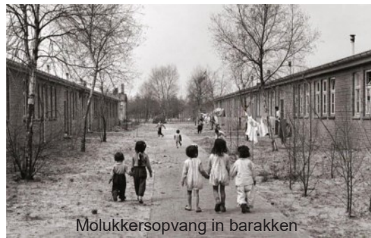
Molukkersopvang in barakken