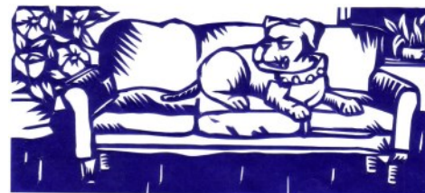
Papierknipkunst: hond op sofa © Paul Marinus Borggreve

In de beeldende kunst spelen de divan en de sofa een bijzondere rol. Volgens westerse schilders uit de eerste helft van de 20 e eeuw werden divans, canapés en