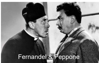
Fernandel & Peppone