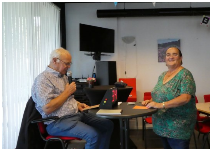
Controle van de bingokaart | Bingo 21 september