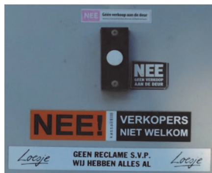
Consumentenbond, Kassa BNNVARA, Loesje

Het onderzoek is in opdracht van KBO-PCOB uitgevoerd door bureau TeraKnowledge® door online interviews. Aan dit onderzoek deden 1.200 mannen en vrouwen mee. Qua geslacht, leeftijd, woongebied, geloof en opleiding representeert deze steekproef de werkelijke verdeling van senioren in Nederland.