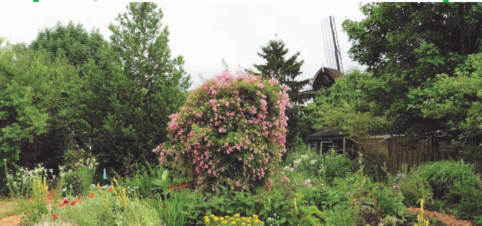
Idylle achter de Doesburger molen